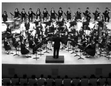
小中学生音楽フェスティバル

10月15日、羽村市小中学生音楽フェスティバルを皮切りに第42回羽村市文化祭がスタートし、ホール部門、展示部門に多くの市民が訪れています。