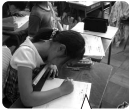
富士見小学校 4年生の活動の様子 ～羽村っていいな～