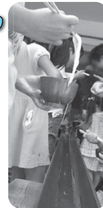
通級児全員と卒業生も集まる「集まる日の会」