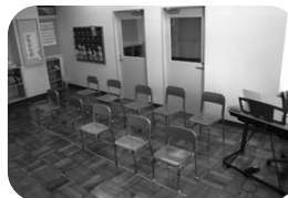
松林小学校小集団学習室

羽村東小学校と松林小学校のどちらに通級しても、ほぼ同じ内容の指導を受けることができます。さまざまな活動を通して、コミュニケーションや社会性に関する内容を実践的に学びます。また、「在籍校訪問」「保護者面談」なども計画的に行い、在籍校や保護者との連携を重要視しています。