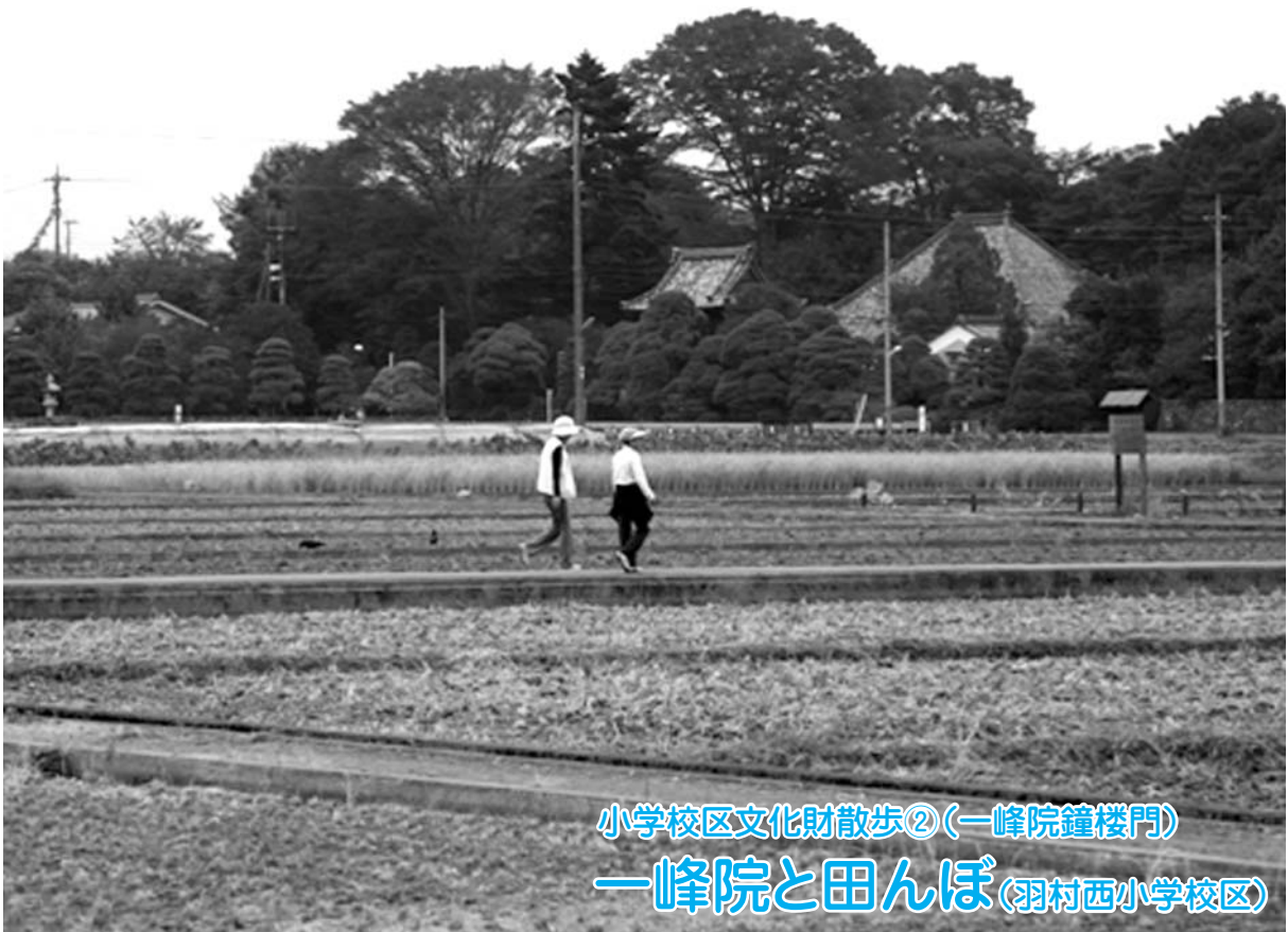
小学校区文化財散歩②(一峰院鐘樓門) 一峰院と田んぼ(羽村西小学校区)