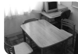
羽村東小学校個別学習室

※通級指導は、児童の様子に応じ、基本的に小集団指導と個別指導を組み合わせで行います。