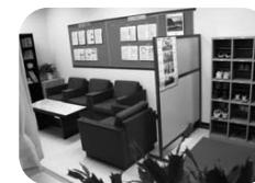
通級専用玄関と待合室