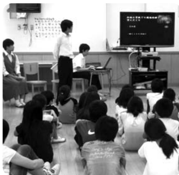
▲羽村二中職場体験報告会