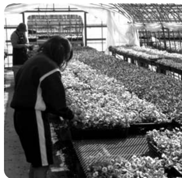
▲羽村三中職場体験