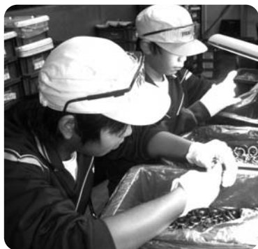
▲羽村一中職場体験

生徒たちは学んだことや反省点などを自分自身で振り返り、この経験から得たことを今後どのように活かしていくのか等わかりやすくまとめて発表していました。