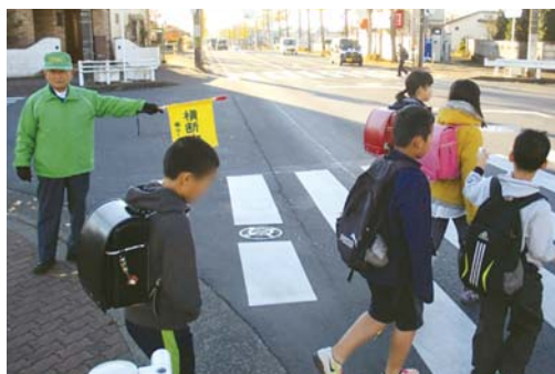
▲児童の登校を見守るスクールガードリーダー

地域の見守り活動をしていただいている皆さん、いつも子どもたちの安全・安心を守るため、ご尽力いただき、ありがとうございます。