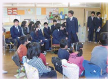
▲特別支援学級の中学生が職場体験の報告会を小学校特別支援学級で行っています。

羽村市では、小中一貫教育を推進しており、中学校区ごとに、9年間を通じた継続的な指導に取り組んでいます。 特別支援学級でも小中のつながりを重視した取り組みをしており、一緒に学ぶ機会をつくっています。