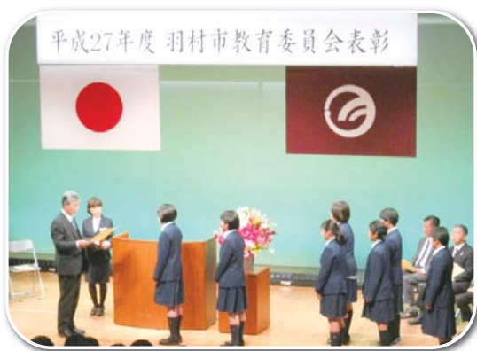
▲平成27年度表彰の様子