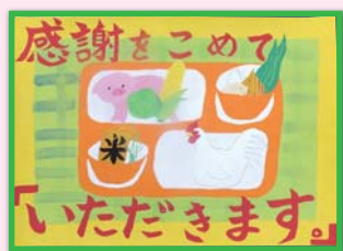
▲本村 夏奈子 (羽村第一中学校2年生)

( http://www.kyushoku.or.jp ) を「ご覧ください」。