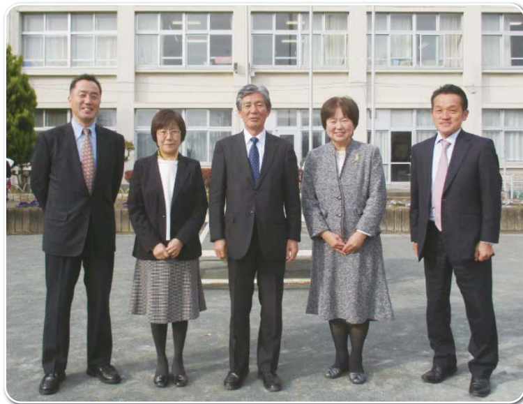
▶羽村市教育委員会委員 (右から)