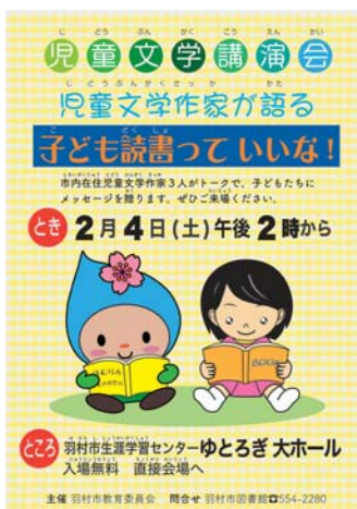
▲児童文学講演会ポスター