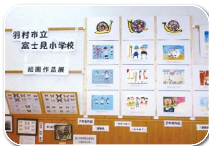
▲昨年の作品展の様子