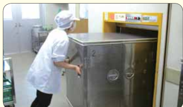
▲2階以上へは、エレベーターで運搬します。