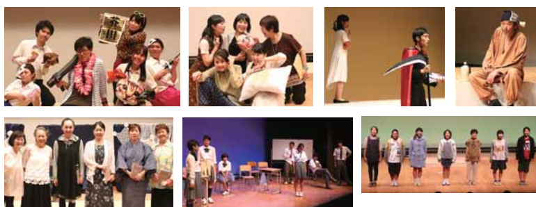
▲主に羽村市を中心に活動している団体

校演劇部】、「福生高校演劇部」、多摩市民塾からスタートした「朗読劇ひびき」、某都立高校演劇部の卒業生で結成した「劇団さんまるはち」、「多摩高等学校演劇部」、「はむらの教育」のメリーリボン関連の取材記事を見て参加し、尺八の生演奏で一人芝居を行った「ひろ+たく企画」