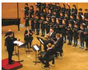
▲子どもたちとの交流演奏