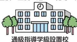
通級指導学級設置校