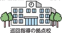
巡回指導の拠点校