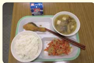
▲給食配膳の一例です。

また、常に衛生面について、注意しています。子どもたちと触れ合い、皆の笑顔や「おいしかったです。」「ありがとうございました。」「ありがとうございます。」という言葉がこの仕事の魅力です。