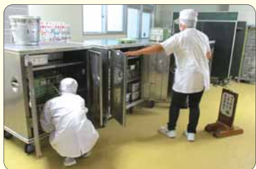
▲子どもたちが給食を取り出し易いよう、学級ごとに給食を分け、ワゴンに収納します。

作業内容は、給食の配膳がメインですが、白衣の点検(ボタンやゴムの補修)、配膳台ふきんなどの漂白・洗濯、学期末には各学級の配膳台やワゴンの磨き清掃も行っています。