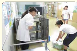
▲子どもたちが給食を食べ終わり、給食作業員さんと一緒に片付ける様子です。