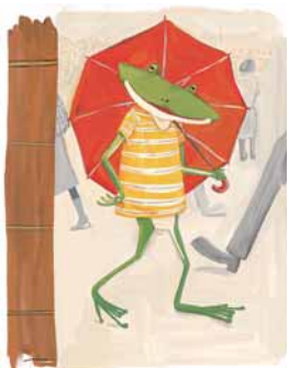
▲第19回日本絵本賞受賞作品「カエルのおでかけ」