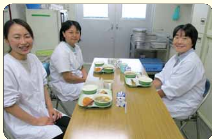
▲武蔵野小学校の給食作業員さん

児童・生徒が美味しく給食を食べられるのは、こういった給食作業員さんがいるからです。いつも、ありがとうございます。