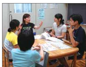
▲羽村東小学校はばたき教室巡回指導教員(情報共有・共通理解のための打ち合わせ)

小学校特別支援教室「はばたき教室」(以下、「はばたき教室」)の本格的な巡回指導が始まって、2年が経過しました。市内96名(8月1日現在)の児童が、各小学校にある「はばたき教室」に通っており、それぞれの児童に応じた支援を受けています。例えば、字を読むのが苦手、静かに話を聞くのが苦手、言葉で相手に思いを伝えるのが苦手など、困っていることがあるとき、「はばたき教室」で学ぶことにより、段階的に学習活動に取り組みことで、自分に合った学び方を知り、在籍学級で苦手に思っていることを軽減することができま。また、同じ悩みや困りごとを抱える仲間と出会い、お互いのコミュニケーションでの学びを通じて、困ったことが起きても対応する力を身に付けることができます。