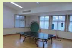
多目的室では、体育を行います。