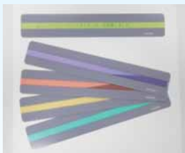
▶リーディングトラッカー

リーディングトラッカーは読みたい行を集中して読むための道具のことです。ご利用ください。