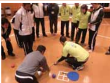
▲ボッチャの研修を受けている様子