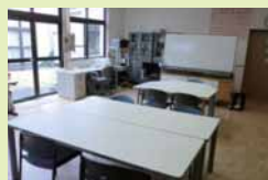
教室では、個別や集団での学習をします。

見学や入室の希望など、まずはお電話でご相談ください。 ☎042-554-1331