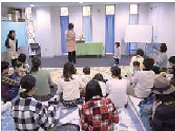
▲赤ちゃんおはなし会の様子

そこで、大人に読み聞かせをしてもらうことで、子どもたちはおはなしの内容も理解でき、楽しさを味わうことができます。図書館では「もっと本の楽しさを知ってもらいたい！」という思いから定期的なおはなし会を行っています。