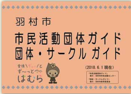
▲団体・サークルガイド冊子

・ 団体として社会教育施設(ゆとろぎ・スポーツセンターなど)を利用する際の使用料が減額されます。 ・ 市の社会教育備品(展示パネル・プロジェクトなど)を無料で使用することができます。 ・ 教育委員会が発行する「団体・サークルガイド」(冊子と市公式サイト)に団体の情報を掲載でき、市民の皆さんやほかの団体に活動をお知らせできます。