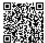
地方税お支払サイト

「地方税お支払サイト」からクレジットカードやインターネットバンキングなどで納付ができます。ただし、クレジットカードでの納付は納付書の金額が1万円以下の場合37円、以降1万円ごとに75円（いずれも消費税抜）の手数料がかかります。