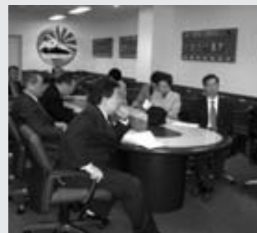
基地広報担当者の説明を聞く

議会では、「羽村市基地対策特別委員会」を設置し、市民生活の安定対策についての調査・研究、関係機関への要請などを行っています。横田基地をめぐる、在日米軍再編問題による航空自衛隊航空総隊司令部の移駐など新たな課題が浮上していることから、去る、11月2日（木）、基地の現状を視察してきました。