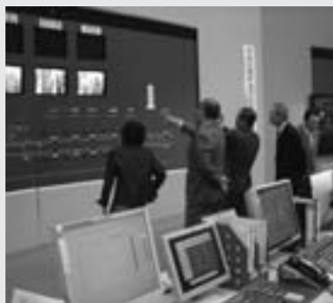
総合司令室を見学

議会では、箱根ヶ崎から羽村市を通過して八王子市へ至る多摩都市モノレールの構想路線が早期に整備され、市の発展につながるよう、「羽村市多摩都市モノレール建設促進特別委員会」を設置し、調査・研究などを行っています。委員会では、去る、10月31日（火）、立川市にある多摩都市モノレール