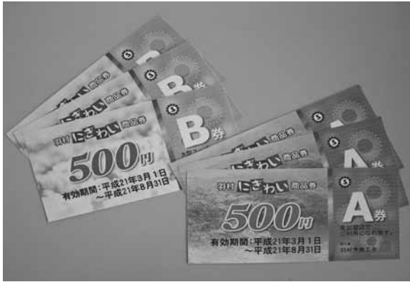
▲3月に発行される「羽村にぎわい商品券」

市長 1冊1万円の商品券に10%を上乗せし、1万1千円分利用できる商品券 質問 10%のプレミアムを付けては。 市長 市独自の市内商品券の実施を。 市長 プレミアム付きの市内共通商品券の発行を行う。 質問 1冊1万円の商品券に10%を上乗せし、1万1千円分利用できる商品券 市長 地元小規模店を保護するため、全店共通で使える商品券と小規模店だけで使える商品券2種類セットとする。なお、運営管理は商工会が中心となる。 質問 市長の中国上海視察の成果は。 市長 各種経済団体との意見交換を行い、連携協力を推進。徐匯区工商業連合会と双方の産業振興に協力していく覚書を交わすことができた。 新型インフルエンザ対策 質問 市独自の行動計画の早急な策定を。 市長 庁内に組織横断的な検討委員会を設置する。また、対応マニュアルの策定に向けて検討していく。 羽村教育ビジョン策定 質問 平成20年3月に現場からの教育