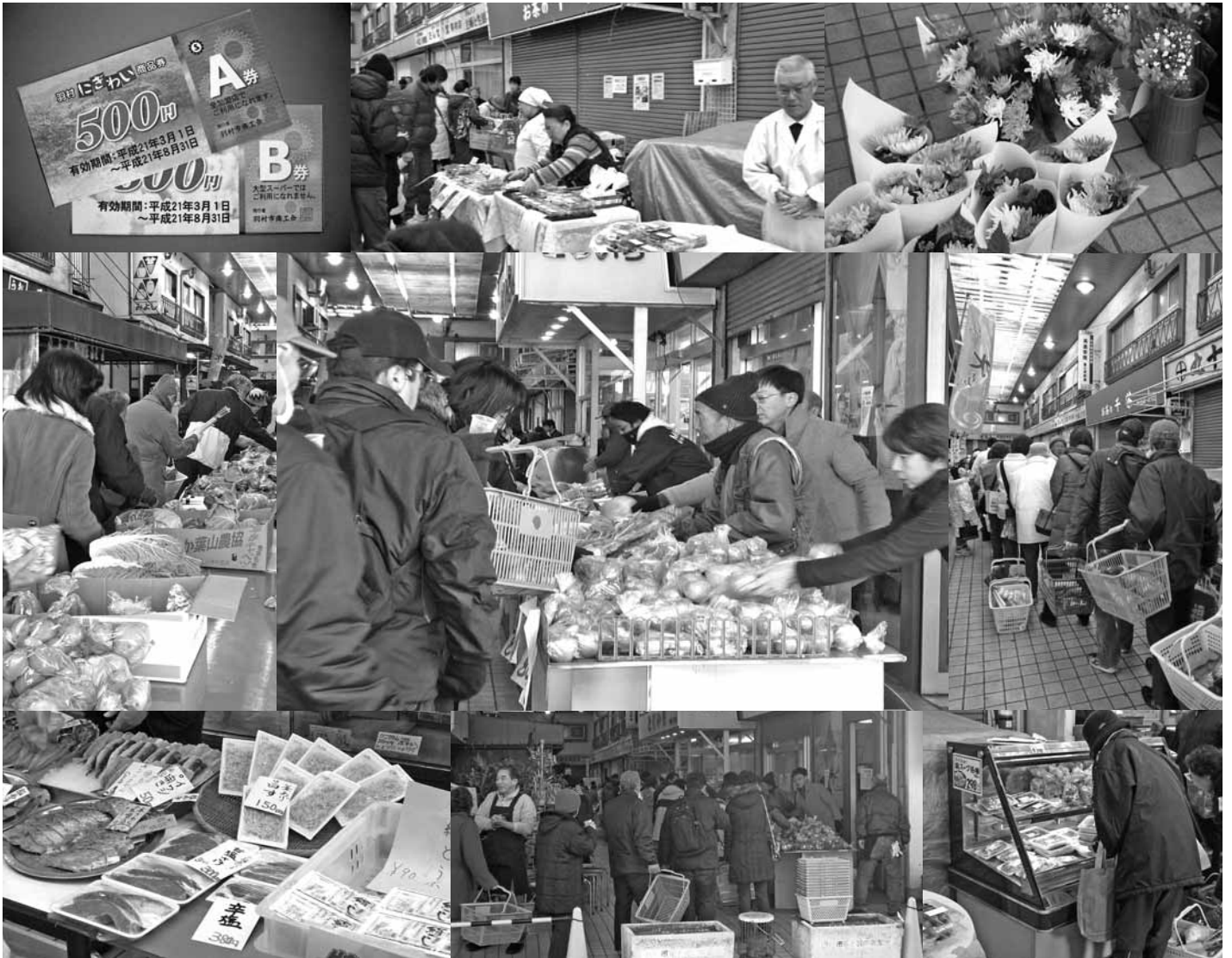
にぎわうマミーショッピングセンター日曜朝市・羽村にぎわい商品券

ホームページアドレス http://www.city.hamura.tokyo.jp/