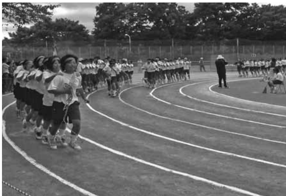
▲体育大会（羽村一中）

教育長 義務教育9年間を通し、きめ細かな教育を実施することで、一人一人の個性や能力を伸ばすシステムであると考えている。今後も検討を進めていく中で意見をいただくとともに、最終的な小中一貫教育校の実施判断は、委員一人一人が判断することで委員としての責任を果たしていくことになる。