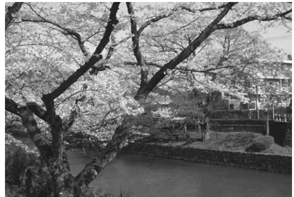
▲羽村市の風景（玉川上水と桜）

しかし、計画事業の中には、さらに取り組んでいかなければならないもの、年月を要するものもあり、こうした残