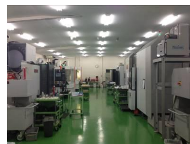
最新の 5 軸加工機と複合加工機