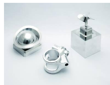
高精度な 5 軸加工

*「TOPsolid」は、当社統合型 3 次元 CAD/CAM システムの商標です。