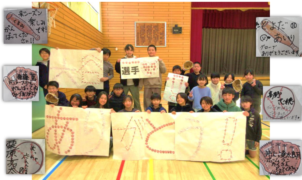
▲「メッセージを記載したメッセージカードをつなげ、「大谷選手♡！ありがとう！」の文字を作成しました。写真は、グローブの見守り活動の中心となる体育委員の児童

全校の児童・職員から有志でメッセージを集め、「大谷選手！ありがとう！」の拡大文字を作成しました。作成した拡大文字は、職員室までの壁面に掲示しています。