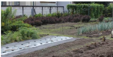
生産緑地。雑草なくきれいに管理されています。