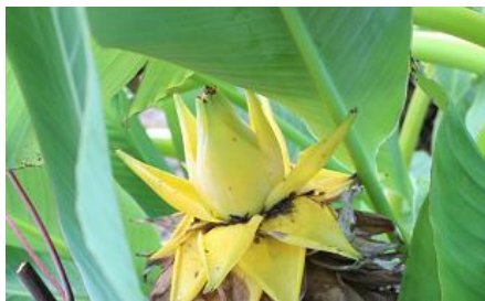
バナナみtainな花。 地湧金蓮（チユウキンレン）

生育して、紫蘇や柚子などを農産物直売所に出荷することもあります。柚子は種のある品種と種のない品種（多田錦）を育てています。今は、毎日が雑草との戦いです。生産緑地なので、しっかりと肥培管理していると思います。