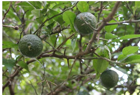
柚子がたくさん実っています。