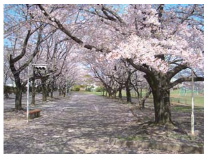
4月上旬の江戸街道公園の様子