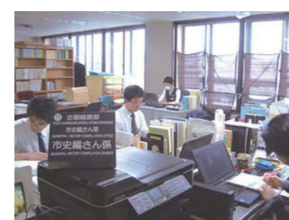
市史編さん室の様子

羽村市の未来について 質問 国の長期ビジョンは2060年に1億人程度の確保とされているが、当市は。 市長 27年度策定の「地方人口ビジョン」で推計値を示していく。 質問 20歳から39歳の女性人口の推移は。 市長 平成22年は7178人だったが、平成27年には6102人である。現在、人口維持の独自施策を検討している。 質問 「地方版総合戦略」は。 市長 魅力ある多様な就業の機会を創出し、羽村市の特色や個性をさらに生かしたまちづくりを進める。 市史編さんについて 質問 市史編さん本部会議の役割は。 市長 役割は、市長を本部長とし、理事者、部長職より構成される最終意思決定機関である。 質問 市史編さん委員会の役割は。 市長 学識経験者5名のほか市内各団体より5名の10名で構成され、市史編さん事業に必要な助言、監修等を行う。 質問 市史編さん事業を進めていく中で得た成果を生かした講座の内容は。 市長 平成27年度より、市史関連講座を実施していく。内容は、秋以降に広報紙等を通じて市民に知らせる。