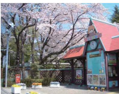
羽村の魅力のひとつ、羽村市動物公園