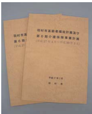
羽村市第6期介護保険事業計画

保険料の期間：平成27年度 ～29年度 所得区分段階の見直し 保険料額の改定 【議決結果】 原案可決