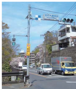
羽村大橋東詰交差点

Q しらうめ保育園の移転完了の予定は。 A 29年4月には保育園に宅地を引き渡せるように工事を進めたいと考えている。