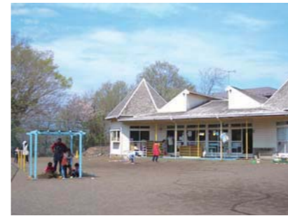
新学期が始まったばかりの東学童クラブ

子ども・子育て支援の推進・充実 質問 地方創生交付金の活用への考えと構想は。 市長 結婚・妊娠・出産・子育ての切れ目のない支援など、羽村の魅力創出に資する施策を展開。まちに賑わいと活力を生み出していく。 質問 待機児童解消に向けて、都の事業の活用と構想をどう描いているか。 市長 積極的な活用を図り、地域全体で子育て家庭を支援していくための取組みを強化していく。 質問 学童クラブの利用対象学年の拡大への考えは。