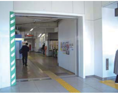
拡幅予定の羽村駅自由通路

羽村駅西口地区の整備と今後の事業展開について 質問 羽村駅西口駅前整備は。 市長 平成27年度から3か年で予定している業務委託では、関係権利者の土地利用の意向を確認し、公共施設を含めた複合施設化や、民間による共同ビル化の支援制度の導入なども視野に入れ、整備促進を図る。