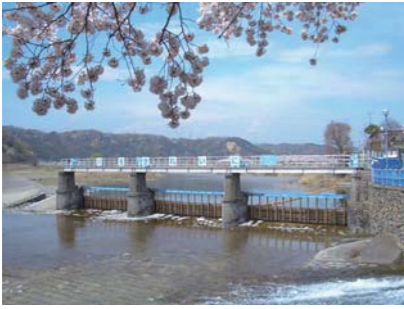
選奨土木遺産の羽村堰

栄町三丁目西部地区 まちづくり方針について 質問 近隣の声も参考に緑地帯の整備も計画を。 市長 栄緑地を市民の憩いの場として充実を図る。