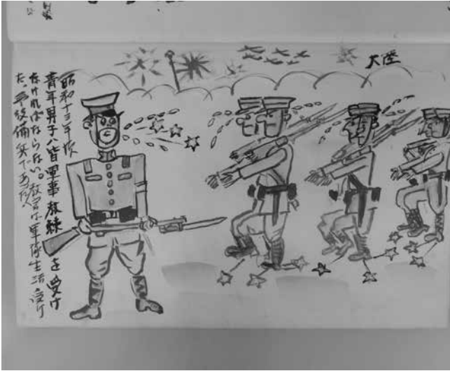
○昭和十三年頃、軍事教練を受けなければならなかった。