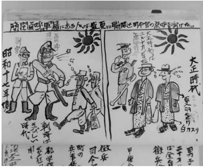
○軍籍にある人は盛夏に司令官の点呼を受けた。