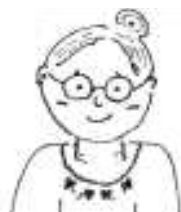
センターのおばさん