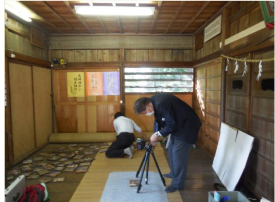
▲松本神社絵馬撮影風景

さらに同時並行して近現代の羽村についての理解を深めるうえでの聞き取り調査を進め、11月・12月に横田基地や区画整理に関してお話を伺いました。