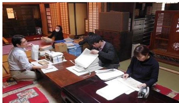
▲江戸時代を担当する第2部会調査風景 (市内旧家にて)

また、幕末から明治にかけて村内で商家や酒造業を営む家も存在したことが記されています。