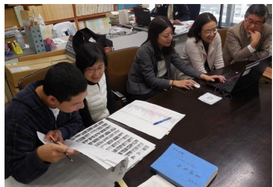
▲古写真確認作業中の第5部会員

また、昭和30年代以降の生活の様子を視覚的に捉えるため、市役所に保管されている古写真を調査しました。懐かしい風景や着ているもの、髪型などから重要な情報を得ることができました。