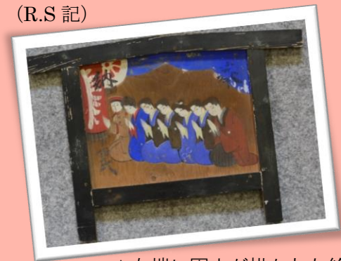
▲左端に軍人が描かれた絵馬

このように絵馬は当時の社会を絵で表現した貴重な資料であるとわかります。歴史の研究手法として、文書資料のみならず、このようなモノの表象からもその時代を読み解くことが出来るのです。これも歴史の面白さといえるでしょう。(R.S記)