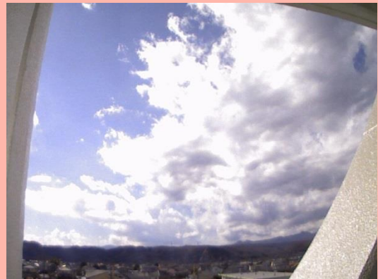
▲庁舎内に設置した定点カメラより草花丘陵を望む

生態班では、9月に続き11月にも市内に出没したイノシシの目撃情報を収集しながら、今後の情報にも注目していきます。