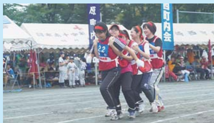
▲昨年の市民体育祭の様子