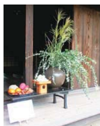
▲昨年のお月見かざり