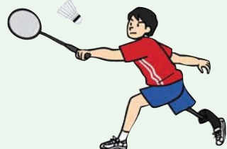
▲迫力満点駆け引きとラリー

■競技会場は国立代々木競技場です。 問合せ 東京オリンピック・パラリン ピック準備室④ 344