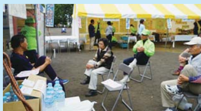
▲昨年の健康フェアの様子