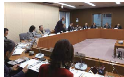
11月7日。松川町議員と議会報作成について意見交換する広報委員会委員。