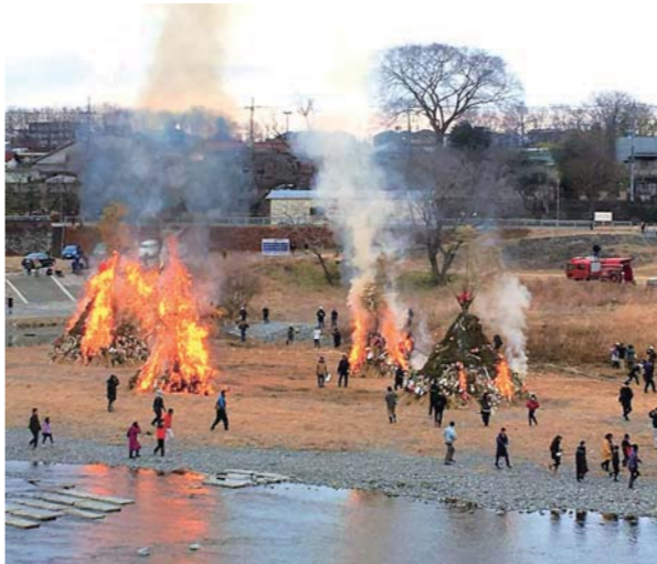
今年のどんどこ焼き（1月8日）

■12月定例会で市長から提出された議案は、条例に関する議案1件、補正予算案5件の合わせて6件で、すべてを可決しました。 ■議員提出議案は、意見書1件を可決しました。主な議案の概要は次のとおりです。