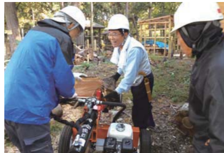
市から借りている薪割り機で間伐材を薪に

美原のグリーントリム公園やそれに続く羽加美緑地は羽村市と住民の協働事業としてきれいに整備され、市民に活用されています。そこには、ふるさとを愛する「美原里山保存会」の活動が欠かせないと言いき、お話を伺いました。(11月30日取材)