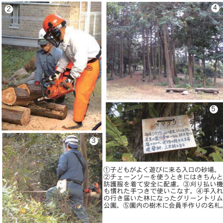
①子どもがよく遊びに来る入口の砂場。②チェーンソーを使うときにはきちんと防護服を着て安全に配慮。③刈り払い機も慣れた手つきで使いこなす。④手入れの行き届いた林になったグリーントリム公園。⑤園内の樹木に会員手作りの名札。