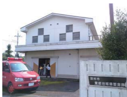
羽村市東部地域備蓄倉庫