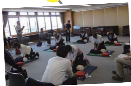
10月26日。議員研修会として普通救命講習を受講する議員。