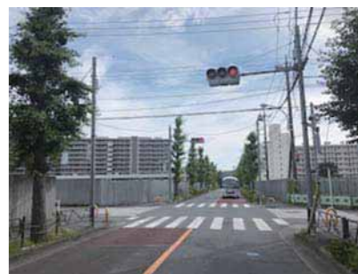
二プロ(株)建設予定地

企業誘致と 定住人口の増加対策 質問 従来の自動車関連企業に加え、新たに医療関連企業の二プロ(株)の進出による、市内の企業の形態も大きく変化しようとしているが、今後の展開をどう予測するか。 市長 新たな業種の企業進出は、その企業の従業員流入、関連企業所の進出、雇用の創出、消費喚起、定住促進等に多大な効果があり、市内活性化につながる。進出企業との連携を図り、周辺環境に配慮しつつ、新たな視点のまちづくりを進め、市内の賑わいと活力の創出を目指す。