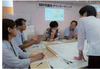
7月7日、市議会タウンミーティングを行いました。詳しくは次号でお伝えします。