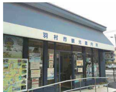
羽村市観光協会が運営する観光案内所