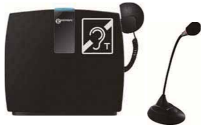
卓上型「補聴支援用具」