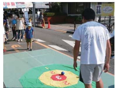
環境フェスでパラリンピックスポーツのボッチャを体験

教育長 羽村市生涯学習基本計画後期基本計画では、「多摩川や自然休暇村における自然体験の実施」を計画事業としている。子どもたちが野外活動や川遊びといった普段の生活ではできない体験を仲間と共有し、お互いが理解し合い、助け合うことを身に付け、地域や学校での集団生活に活かすことを目的として取り組んでいる。今後も、こうした羽村の環境を活かした学びの機会を創出していく。