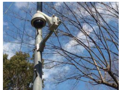
通学路の危険個所に設置された防犯カメラ