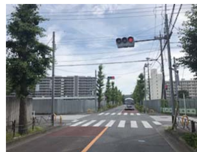
ニプロ(株)建設予定地

り、市内の企業の形態も大きく変化しようとしているが、今後の展開をどう予測するか。