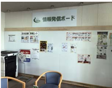
産業福祉センター内「情報発信ボード」

市長 産業福祉センター内の「情報発信ボード」において、市内不動産会社等が空き店舗情報として掲示し、市内に出店したいとの問い合わせがあった場合に、情報提供などの取組みを実施している。