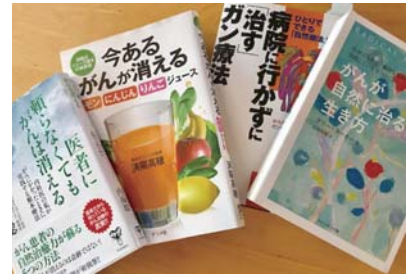
代替治療などに関する書籍

市長 糖尿病は重症化すると腎不全、人工透析へと移行する可能性があり、重症化予防の観点から受診勧奨を行う考えである。