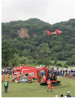
6月17日に行われた水防訓練

市長 「羽村市総合防災訓練」は、毎年9月の第一日曜日に、全市民の皆様を対象として、実施している訓練である。より多くの皆様が参加し防災意識の向上と普