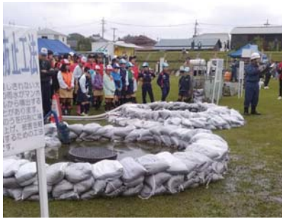
子どもたちも参加した水防訓練