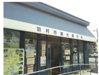
羽村市観光協会が運営する観光案内所

市長 医薬品・医療機器関連施設を早期に建設していくことを目指している。本年10月に工事着手していく