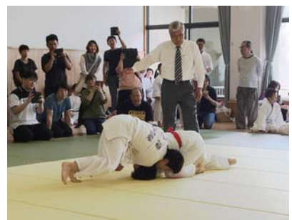
5月にスポーツセンターで行われた柔道大会

質問 事前キャンプ誘致事業を機に、『ソフト面でのレガシー』として、国外姉妹都市交流に繋がるよう取り組んではどうか。 市長 選手と市民の交流な