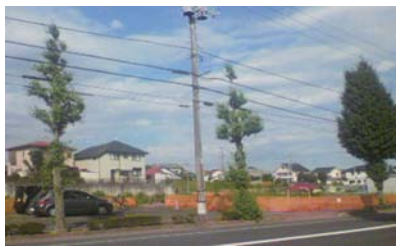
川崎のドラッグストアの跡地