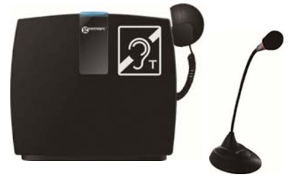
卓上型「補聴支援用具」