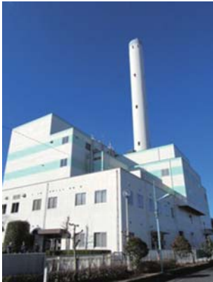
31年度末で稼働が終了する昭島市清掃センター