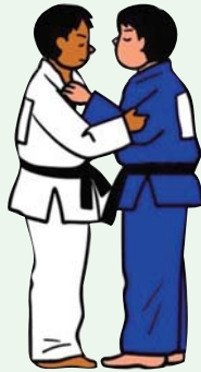
▲一瞬をつかめ

組み手争いがないため、試合開始直後から一本狙いの大技が繰り出されることが多く、激しい技の応酬は見応えがあります。また、試合終了間際の形勢逆転もあり、5分間の試合は、片時も目が離せません。