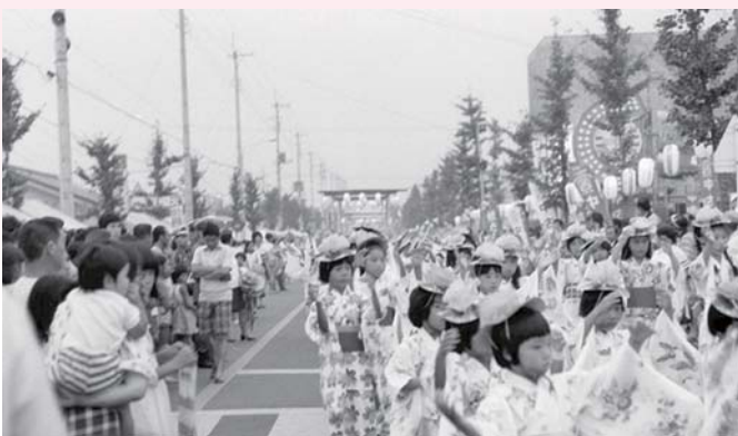
▲第1回はむら夏まつり 昭和51年8月