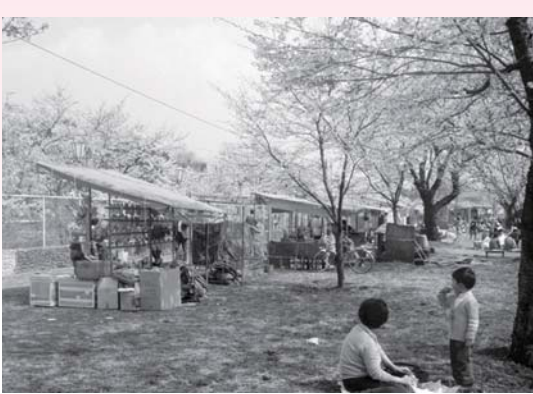
▲さくらまつり 昭和50年4月