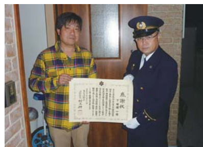
▲消防総監感謝状を贈呈