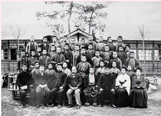
▲西多摩小学校 明治後期