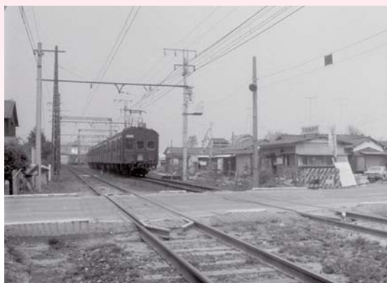
▲青梅線 昭和41年ごろ