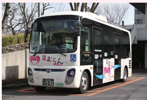
▲でんきバス「はむらん」平成24年3月

市では「羽村市史」編さん事業が進行中です。平成33（2021）年度に「羽村市史」を刊行する計画です。原始から現代にいたる歴史的な事象にとどまらず、自然環境や風俗習慣などの内容についても「羽村町史」以降の研究成果を取り入れ、市内・外に残されている資料を十分に活用しながら、わかりやすい、読みやすい「羽村市史」を目指しています。特に「羽村町史」では触れられていない戦後の時代を充実していきます。そのために、平成29年度から平成32（2020）年度までの間に各分野の資料を収集した「資料編」を作成・刊行し