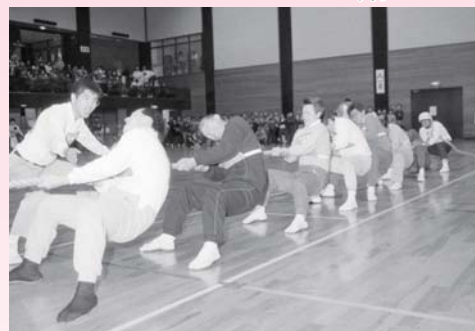
▲NHK杯争奪ふれあい綱引き大会 平成元年2月