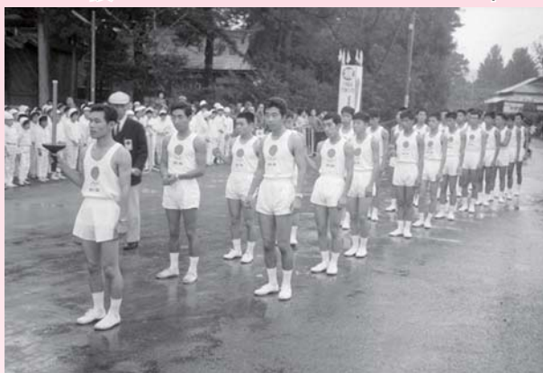
▲オリンピック東京大会聖火ランナー 昭和39年10月