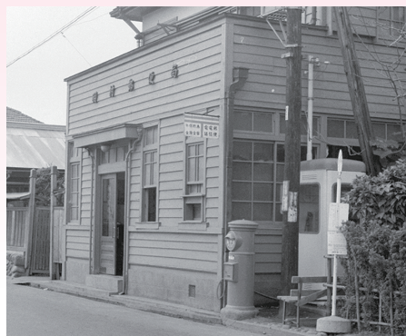
▲羽村郵便局 昭和41年ごろ (現在の羽村南郵便局)