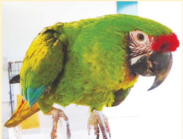
▲ミドリコンゴウインコの「ミント」