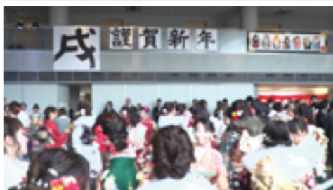
▲昨年の成人式の様子