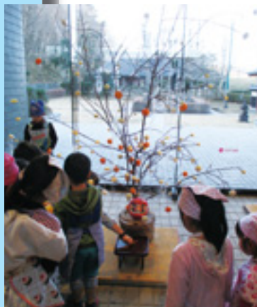
▲昨年の飾りつけの様子