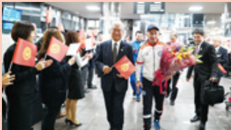
▲市役所を訪問した選手の皆さんを歓迎