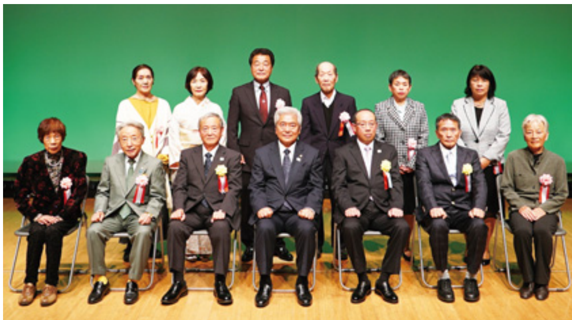
▲表彰された皆さんと並木市長

11月1日、羽村市自治功労者等表彰式典をゆとりぎで行い、自治の振興や公益の増進などに功労のあつた次の方を表彰しました。