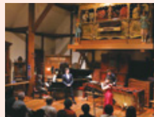
▲クリスマスコンサートの様子(6人の音楽家と楽しむクリスマス)

申込み・問合せ 事前に、電話または直接 萌木の村へ ☎ 0551-48-3522