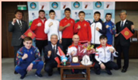
▲市長室で記念撮影