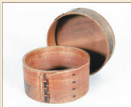
▲ふたを開けたメンパ