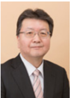
▲芳野潔アナウンサー