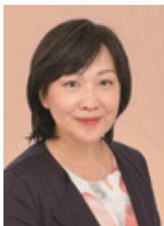
▲森田美由紀 アナウンサー