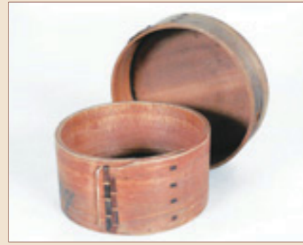
▲ふたを開けたメンパ

まげもの 曲物の弁当箱で「わっぱ」などとも呼ばれます。昭和時代の初めごろ、畑仕事や山仕事での食事のときによく使われていました。スギやヒノキの薄い板を、小判形や円形に曲げてとじ、底を付け、同様のふたをかぶせてあります。内部の水分をほどよく吸収し、ごはんやおかずが湯気で水っぽくならない機能性や、金属やプラスチックの弁当箱にはない木の風合いが持ち味です。