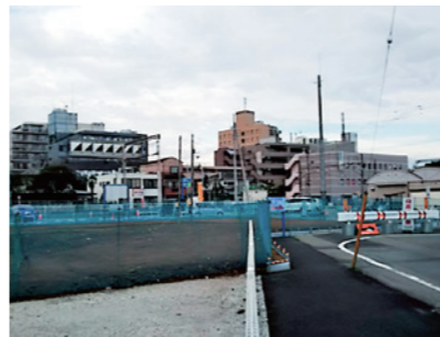
整備が進む羽村駅西口駅前

羽村駅西口土地区画整理事業 計画変更について 質問 単年度の事業費はどのくらいになるか。 市長 平均約20億6千万円である。 質問 西口基金からの繰り入れは難しいが、どのように財源を確保するのか。 市長 都市計画税と市債を計画している。このほか、新たな財源として住宅市街地総合整備事業などの国庫補助金の獲得に、引き続き努めていく。 質問 終了時の2037年に、区画整理事業の市債残高はどの位と想定しているか。 市長 約54億円と試算している。