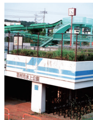
止みが決定した流るプール