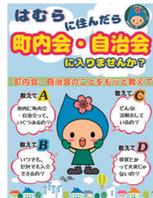
町内会・自治会への加入を呼びかけるパンフレット