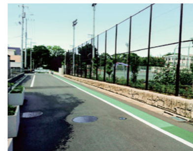
整備が済んだ羽村東小学校前の道路

羽村駅西口土地区画整理事業について 質問 資金計画は最大で年17億円余となっている。財政面の裏付けはどうか。 市長 交付金を差し引いた15億7千100万円が市費負担分。都市計画税を約4億8千700万円、市債を約10億8千400万円充当する計画である。 質問 各区画の完成年度の見通しはいつ頃示されるか。 市長 福生市側の地区界から羽村駅前周辺に続く地区は、平成27年度から令和11年度まで。羽村駅前周辺に続く地区から水道事務所へ続く道路までは、令和5年度から13年度まで。水道事