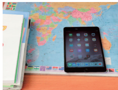
授業や家庭での個別学習で利用が期待されるタブレットPC

小・中学校教育のICT化の現状について 近年、教育現場のICT整備が進んで来ている。タブレットPCは、児童・生徒へのきめ細かい指導と学習意欲向上が見込まれるツールと考える。 質問 ICT環境整備の現状と目標は。 教育長 現在、全小中学校のコンピュータ教室に、パソコンが各40台他、周辺機器を整備している。学校にどのような形でICT環境を整備し、活用していくことが効果的であるかとの視点に立ち、ICT機器整備計画の策定を進めていく。 質問 Wi-Fi整備は