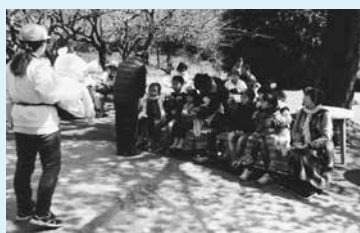
羽村市動物公園での 実演の様子

羽村市青少年アドバイ座は、子どもたちやお年寄りを中心に、可愛い、たくましい、間抜けなどの色々な人形を使って、心に笑いのきずなを届ける、社会の福和術（腹話術）のボランティアグループです。羽村市動物公園での実演では、福和術や紙芝居、手品、クイズ等を織り込み、市外の方々にも楽しんでいただいています。福和術は、決して難しくなく、楽しみながら学び、人を楽しませることができるのが特徴です。会員は、毎日募集しています。