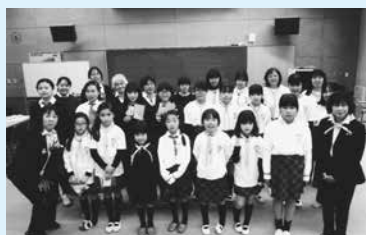
福島県いわき市へ訪問した時の様子

ガールスカウトは、世界 145 国 1,000 万人の会員が活動する女性団体です。「少女と若い女性が責任ある世界市民として、自ら考え、行動できる人となること」を目的として活動しています。募金活動、市や福祉の行事などのお手伝いができるように多くの学習や体験を行っています。また、発団 35 周年の記念行事として、3 月 28 日～29 日に東日本大震災の被災地である福島県いわき市を訪問しました。地元のガールスカウトの皆さんと交流を持ち、「震災体験」の紙芝居を見たり、語り部さんのお話を聞いたりして多くの防災学習をしました。