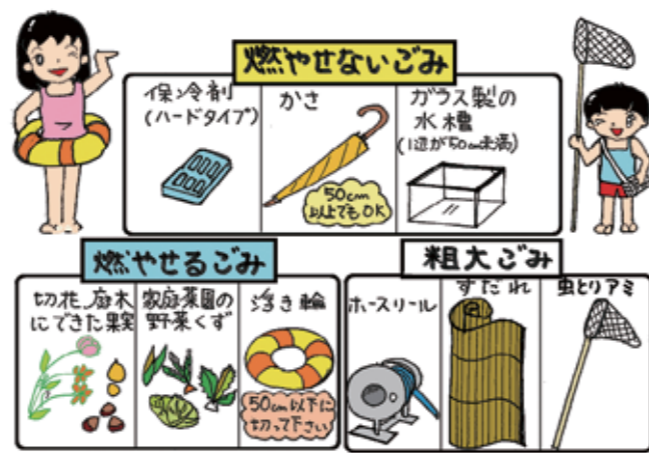
※粗大ごみ...50cm以上のもの