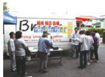
▲「健康フェア」でも結核検診が受けられます。「健康フェア」について詳しくは3ページをご覧ください。