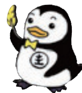
▲更生ペンギンのホゴちゃん