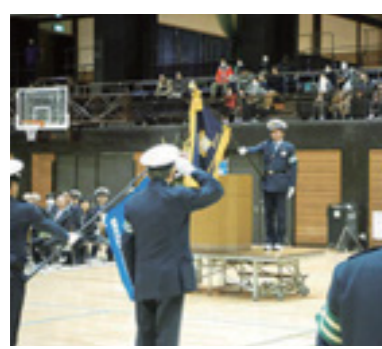
▲昨年の出動式の様子

交通安全推進委員会は、交通安全の街頭指導や、広報活動、各種行事の交通整理など、交通安全のためにさまざまな活動をしています。出動式では、富士見小学校金管バンドの演奏に合わせて、推進委員が分列行進を行います。観覧自由です。ぜひお越しください。