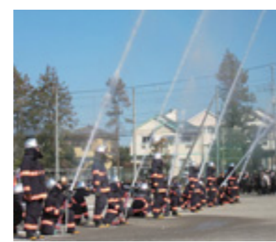
▲昨年の消防出初式の様子

新春恒例の羽村市消防団消防出初式を行います。出初式では、消防車両による一斉放水など、団員が日頃の訓練の成果を披露します。また、今年も羽村第一中学校吹奏楽部の演奏に合わせて、団員が分列行進を行います。※当日は午前8時にサイレンを鳴らします。火災と間違えないよう注意してください。