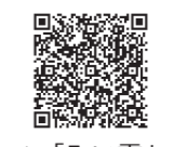
▲「みい電」ウェブサイト

店・小規模オフィス 問 キャンペーン事務局 ☎ 0120-267-100 ☎ 0570-058-100 / 東京都環境局次世代エネルギー推進課 ☎ 03-5388-3402