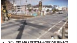
▲ JR 青梅線羽村東部踏切

作業中は通行止め(迂回あり)になるほか、重機械類の騒音などが発生します。ご理解、ご協力をお願いします。