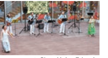
▲ Sing Aloha Friends

※新型コロナウイルス感染症対策として間隔をあけて鑑賞していただきます。マスク着用、手指消毒、受付記帳にご協力をお願いします。