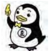
▲更生ペンギン ホゴちゃん