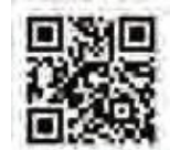
▲Eメール作成用フォーム