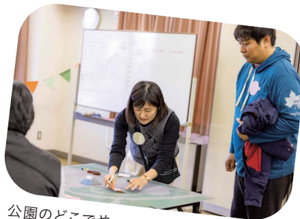
公園のどこでやってみたいかふくらませる