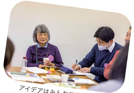
アイデアはみんなで持ち寄り!