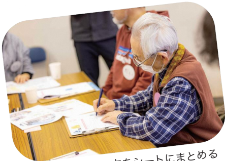
公園での過ごし方をシートにまとめる

3月2・3日のイベントで、どんな風に過ごしたいか、それぞれの日程に分かれてシートにまとめ、必要な準備や備品をチェックしました。最後は、みんなでタイムスケジュールを共有。当日にみんなに持ち寄ってもらいたいものや協力の呼びかけも行いました。