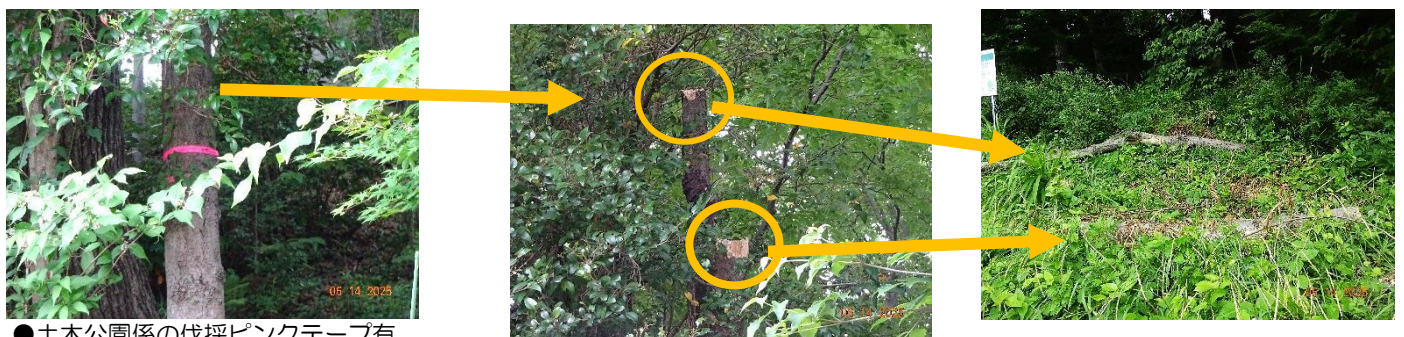
●土木公園係の伐採ピンクテープ有