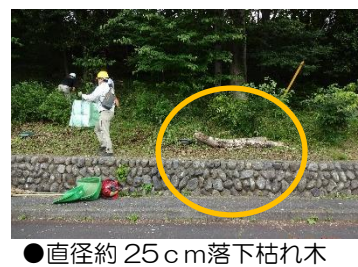
●直径約 25cm 落下枯れ木