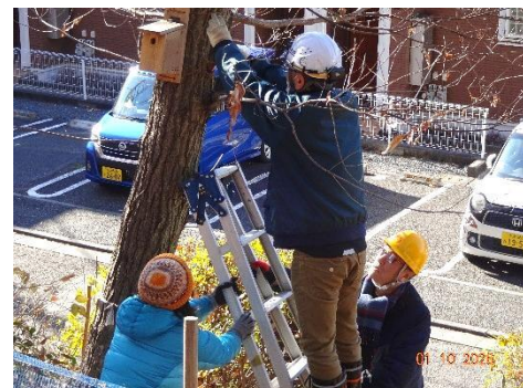
●R7-8 途中 営巣放棄