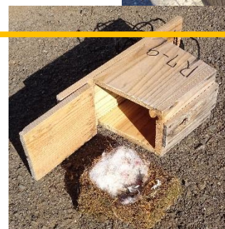
●R7-9 崖線上道路 南詰め 営巣確認