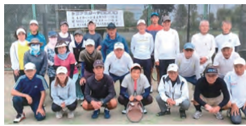
▲シニアテニス技術講習会参加者の皆さん

引き続き、テニス連盟の活動により、羽村市の推進するスポーツを通じた健康づくり、まちづくりへ貢献してまいります。