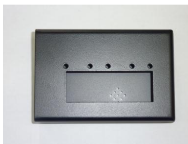
ケース:プラスチックから板金化(設計製作) R曲げ、ヘミング、段付け加工