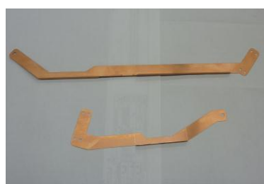
極薄板金 銅板 0.3t タレットパンチ、ベンディング加工