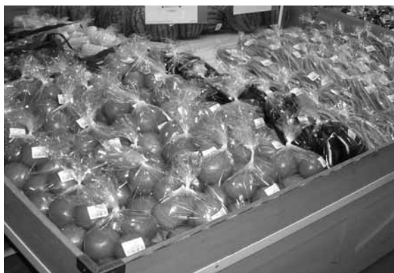
▲農産物直売所に並ぶ地元野菜