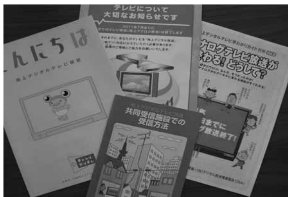
▲地上デジタル放送のパンフレット