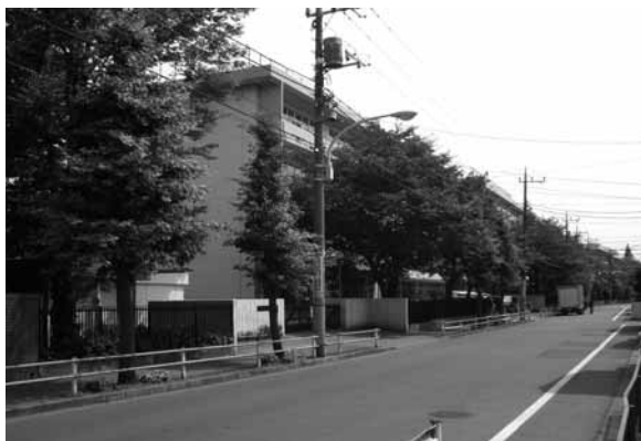
▲武蔵野小・羽村三中前の通り