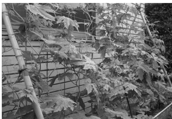
▲市役所で育成中の「緑のカーテン」

市長 平成20年度から、同一世帯2人 以上が保育園同時在園のほか、幼稚園 等に入園している場合も、保育料軽減 対象とし、保育園の保育料もこれまで の4分の1から10分の1に軽減した。 また、幼稚園の保育料も、昨年6月、同