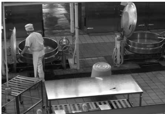
▲給食センターでの作業の様子

いるとのことである。 2学期制について 質問 実施後4年経過したが、事業の検証は行ったか。 教育長 導入1年目に各学校において2学期制の成果と課題を出し、改善を進めた。 質問 実施して教育現場の負担は増えたか、減ったか。 教育長 2学期制での教員の取り組みは、どのような学期制であれ、教員が本務として子どもたちのために行うことであるので、負担が増えたか減ったかという判断はできない。いずれにしても、課題を改善して2学期制をより良いものにしていきたい。