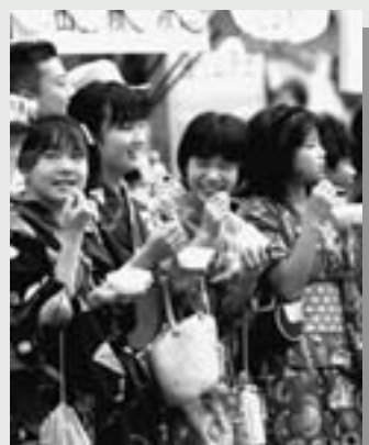
△浴衣姿で祭りを楽しむ方も多く見られました

今年も、1日目の人波踊りや2日目の参場コンテストを中心に、たくさんのお祭りや催しものが行われました。