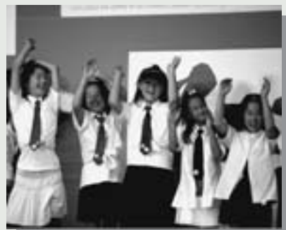
△参場コンテスト優勝の「シュガーII」