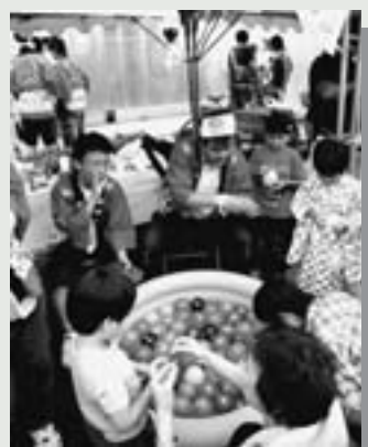
△100店以上の模擬店が出店し、夏まつりを盛り上げました