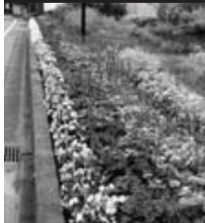
最優秀賞(花壇の部)