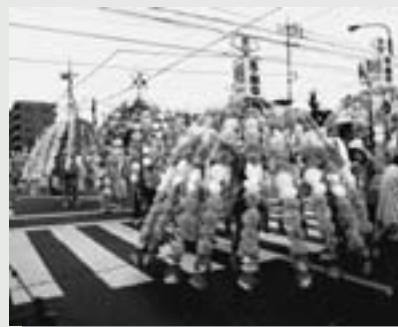
△鮮やかな万燈が会場を魅了しました