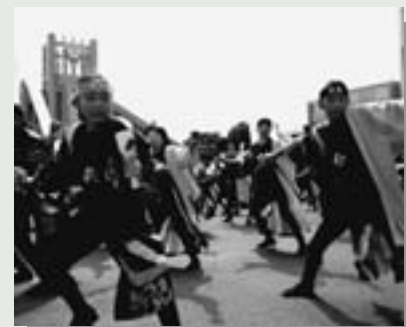
△見事なよさこいソーランを披露してくれた「ジョイソーラングループ」