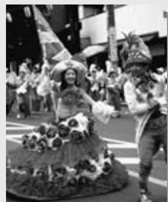
△華やかなサンバを踊った「ウニアン・ドス・アマドーリス」