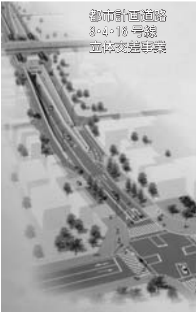
都市計画道路 3・4・16号線 立体交差事業