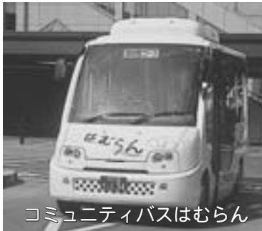
コミュニティバスはむらん