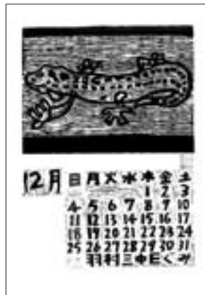
台「マダガスカルミドリヤモリ」 大橋宏紀さんの作品