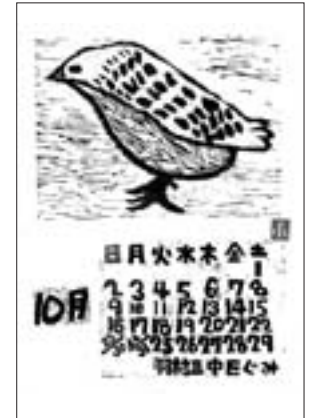
「キジ」 小針翔一さんの作品