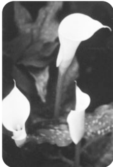
(写真・文) 中島勝衛さん

水辺を好みますが、このほか陸地性のももあり、また形の大小や花の色もさまざまで、切花や鉢植えにされています。