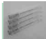
▲混入された注射針

5月18日(火)に回収した有害ごみの中に、注射針が混入していました。この注射針が作業員に刺さり、けがをする事故が発生しました。注射針の混入は大変危険です。 市では、注射針を収集・処理することはできません。処分方法は、医療機関または調剤薬局へ問い合わせてください。皆さんのご協力をお願いします。 問合せ 生活環境課 生活環境係