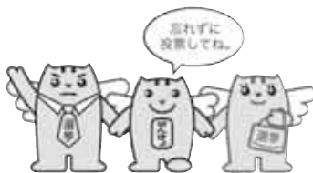
▲明るい選挙のイメージキャラクター「選挙のめいすい（明推）くん」家族