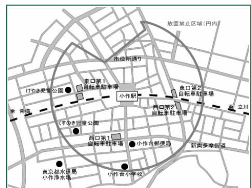
▲小作駅周辺の自転車駐車場および放置禁止区域