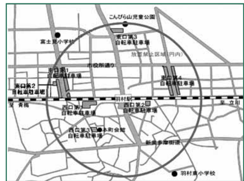
▲羽村駅周辺の自転車駐車場および放置禁止区域