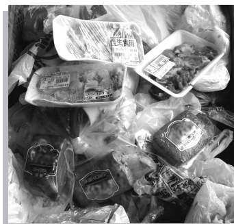
▲燃やせるごみの中に入っていた未開封の肉や魚介、ハムなど

10月に燃やせるごみで出されたごみの中身を調査したところ、次の写真のようなものが入っていました。