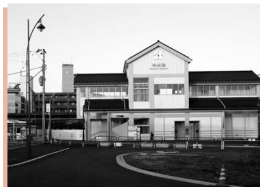
▲ 4月19日(火)現在の羽村駅西口の様子