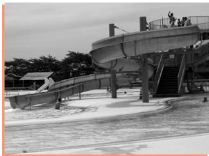
▲流れるプールとスライダー

流れるプールやスライダーなど、お子さんに人気の水上公園が、今年もいよいよオープンします。プールで遊んで、夏の暑さを吹き飛ばしませんか。