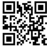
▲登録用 QR コード

あて先に直接 hamura@entry.mail-dpt.jp を入力するか、右の登録用 QR コードを読み込んで、空メール(タイトル・本文未記入)を送信する。