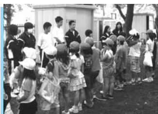
▲小中一貫教育「清掃活動」

□羽村第三中学校区:武蔵野小学校・羽村第三中学校 問合せ 学校教育課小中一貫教育担当