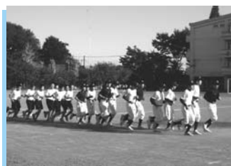
▲小中一貫教育「部活体験」