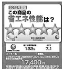
▲統一省エネルギーラベル

エアコンや冷蔵庫を省エネ性能に優れた製品に買い替えたり、照明を電球型蛍光灯やLED電球に交換することで、消費電力と電気代を削減することができます。製品を選ぶ時は「統一省エネルギーラベル」を確認しましょう。★印の数が多いほど省エネ性能が高いことを示します。 また、部屋の広さや家族の人数に応じてどのような機能が必要なのかも考えて製品を選びましょう。